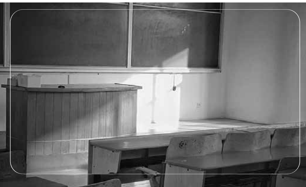
Chiếc ngăn bàn năm nào là nơi chúng tôi liên lạc với nhau

Một sáng tháng 4, giữa giờ giải lao ở lớp, tôi nằm nghiêng áp má xuống bàn, mắt nhìn lên bầu trời cao trong veo. Cái nắng tháng 4 dễ chịu quá, tôi để mặc những tia nắng xuyên qua tán lá, nháy nhót trên bầu má còn lại của mình. Tôi chợt suy nghĩ vu vơ. Với tâm hồn của cô gái 16 tuổi, đôi lúc tôi thắc mắc mối quan hệ giữa tôi và Huy là gì? Liệu Huy có thích tôi? Liệu có phải chỉ bản thân mình đa tình? Rất nhiều những suy tư, những câu hỏi không thể giải thích được, nhưng chỉ một điều tôi chắc chắn: “Minh thích Huy” .