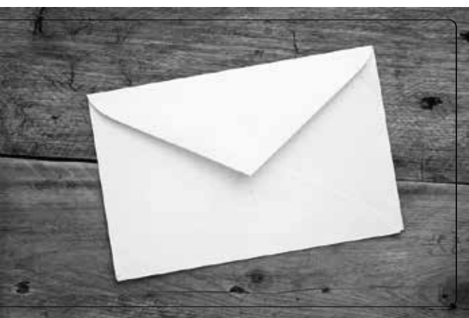
Lá thư tỏ tình được giấu kín trong học bàn.

Biết bao câu hỏi lần lượt hiện lên trong tâm trí ta. Bản thân mình lo được lo mất, sợ hãi mà không dám tỏ tình. Chính vì vậy, ta đành tìm đến một cách thổ lộ kín đáo hơn, gửi gắm tâm tư sâu kín vào từng con chữ được nắn nót trong thư.