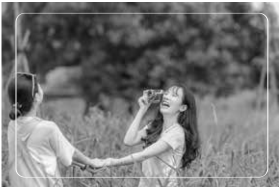
Rủ bạn bè đi chơi đâu đó là cách hay để bạn giải tỏa muộn phiền

Những người thân yêu sẽ giúp bạn chóng quên thương tổn và khổ đau, giúp bạn trở lại là chính mình sau chia tay. Đừng nhốt mình trong chiếc vỏ ốc của sự cô đơn.