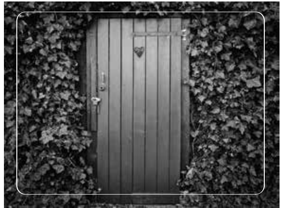
Đừng đóng cửa trái tim nhưng cũng đừng vội vàng tìm mối quan hệ mới

Khi nào trái tim bạn đã sẵn sàng, những mối quan hệ tốt đẹp sẽ đến thôi.