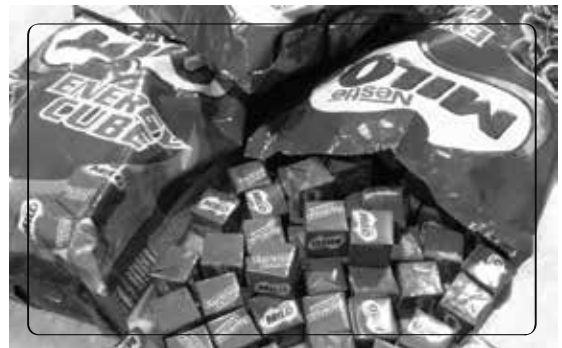
Thức ăn trong ngăn bàn được san sẻ cho các bạn.

Sau những tiết ra chơi ngắn ngủi, ta thường ôm theo một đồng bánh kẹo bước vào lớp học. Thức ăn vặt được để vào ngăn bàn, trong chốc lát đã không thể nhét thêm được nữa.