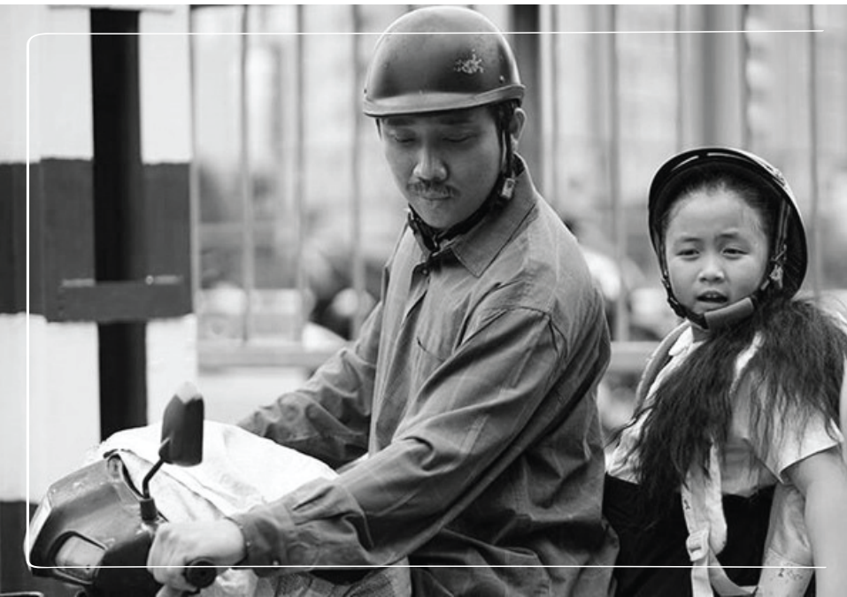
Tôi và cô bé Bù Tọt có một điểm chung – luôn được bố đưa đến trường trên con xe dream cũ

Lên cấp ba, bố mẹ sắm cho tôi một chiếc xe đạp điện để tôi đi đến trường. Còn nhớ năm đó tôi học lớp 12, vào một buổi tháng mùa thu đẹp trời trên đường Phan Đình