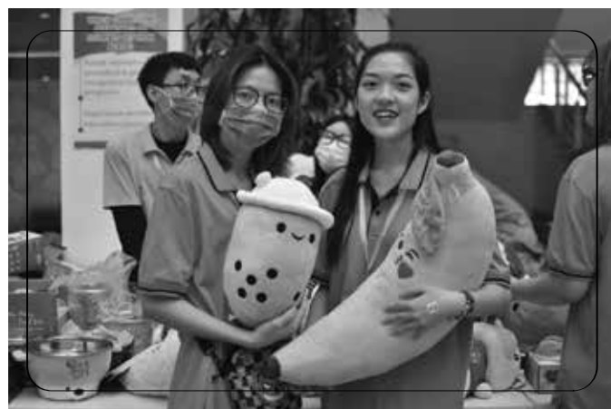
Nhiều phần quà đáng yêu đã được BTC “Vòng tay ấm 12” chuẩn bị tặng người tham gia hiến máu

Sự kiện “Vòng tay ấm” đã bước sang năm thứ 12