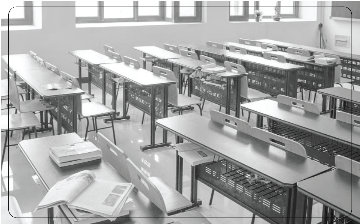
Chiếc ngăn bàn nhỏ chưa đựng bao bí mật học trò

Thời gian trôi qua thật nhanh, thoáng chốc ta đã không còn là một thiếu niên ngây ngô, cũng không phải là một cô gái tràn ngập tâm hồn thiếu nữ như thuở ban đầu. Chúng ta giờ đây đã trưởng thành hơn và phải lo lắng nhiều hơn cho cuộc sống tương lai.