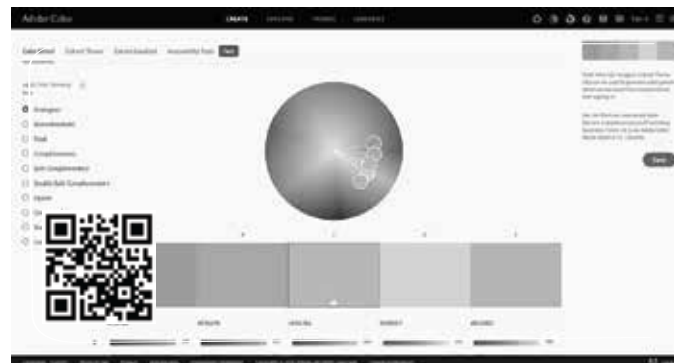
Đơn giản – tiện lợi – dễ dùng là ba yếu tố hữu ích hội tụ ở Kuler

Website này sẽ giúp Cóc chọn các màu phối với nhau sao cho nổi bật và đẹp mắt nhất. Đơn giản – tiện lợi – dễ dùng là ba yếu tố hữu ích hội tụ ở Kuler. Việc của các Cóc chỉ đơn giản là di chuyển hình tròn xung quanh bánh xe màu sắc và Kuler sẽ chọn ra một loạt các màu sắc phù hợp. Quá tuyệt vời đúng không.