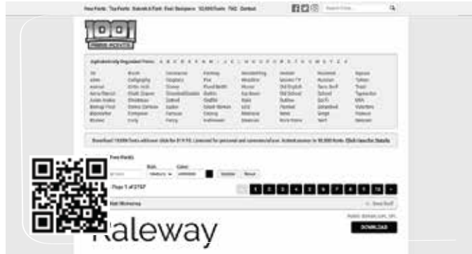
1001freefonts là một kho font chữ khổng lồ

Nếu Cóc nào “chịu chi” cho gói tài khoản “xịn” thì còn có thể sở hữu thêm những bộ font vừa đẹp vừa độc nữa cơ. Bên cạnh đó, thư viện của 1001freefonts http://www.1001freefonts.com/ cũng được sắp xếp theo vần rất khoa học, giúp việc tìm kiếm font dễ dàng hơn.