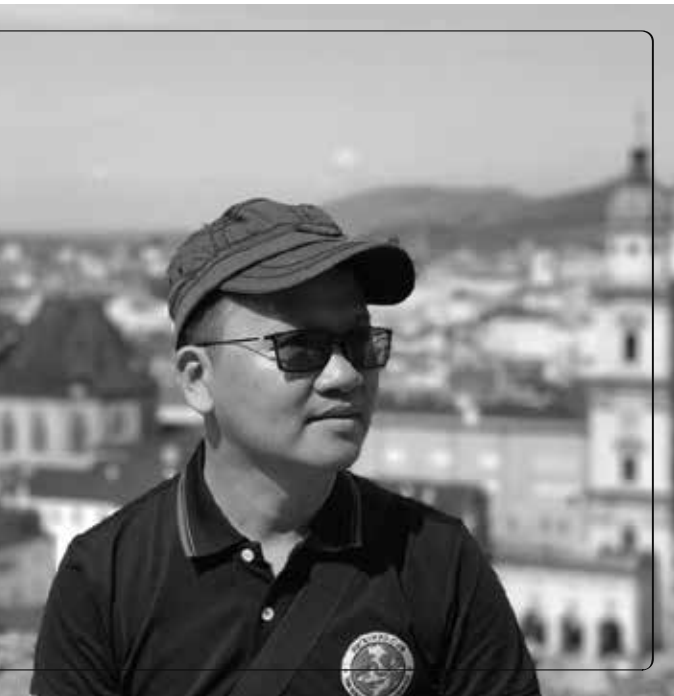
Chân dung thầy Ngọc Anh

Được truyền cảm hứng làm “đồ Cóc” từ cha