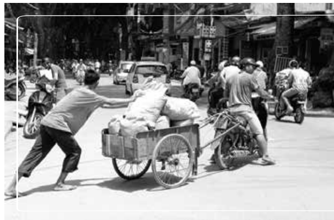
Bóng lưng người đàn ông trung niên khiến tôi suy nghĩ nhiều về bố mình

Mỗi lần như vậy, hai bố con lại ăn tối nhanh để đưa tôi ra bến xe. Tiếng trò chuyện của hai bố con lúc nào cũng rôm rả cả một góc đường. Trên đường đi, tôi chợt bắt gặp hình ảnh một bác cũng đã trung niên ngang ngang tuổi bố tôi đang nai lưng kéo xe chở hàng