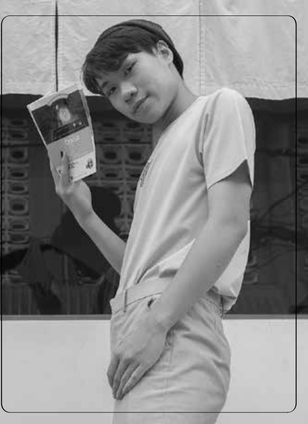
Cậu bạn đa tài hiện cũng là giáo viên, người mẫu tự do

hay nói mình tham công tiếc việc nhưng bản thân lại thấy làm được làm những điều mình thích là điều tuyệt vời nhất” – Lâm tâm sự.