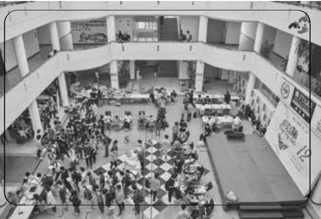
Rất đông sinh viên ĐH FPT Hà Nội đã đến hưởng ứng “Vòng tay ấm 12”

Quy trình hiến máu tại sự kiện tuân thủ đúng và đầy đủ các bước theo quy định của Bộ Y tế để đảm bảo an toàn sức khỏe cho người hiến và cũng để đảm bảo chất lượng máu. Từ bước kiểm tra cân nặng, đo huyết áp, nhịp tim... đến việc xác nhận có đủ điều kiện tham gia hiến máu hay không đều được các bác sĩ Viện huyết học và Truyền máu Trung Ương thực hiện cẩn thận và chặt chẽ.