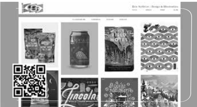
Đây là website giúp Cóc tham khảo nhiều sản phẩm cực kỳ ấn tượng

Với giao diện nhìn là muốn “yêu từ cái nhìn đầu tiên” và rất thân thiện với người dùng, Eric Nyffeler sẽ giúp Cóc được tìm hiểu, học hỏi từ phong cách thiết kế này và từ đó hình thành những ý tưởng riêng của mình. Địa chỉ website: http://ericnyffeler.com/