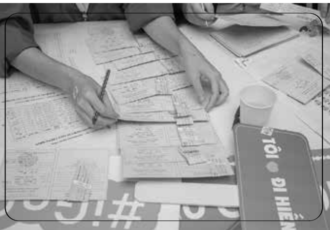
Hàng trăm tấm giấy chứng nhận đã được trao đi