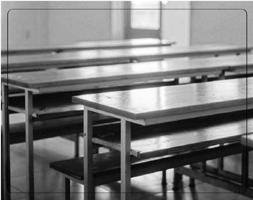
Chiếc ngăn bàn – “địa bàn” cho những trò vui “nổ trời” năm nào của chúng tôi

Ngày còn đi học, vì cận thị, lại thấp bé nhẹ cân nên tôi thường được các thầy cô ưu ái cho ngồi ở bàn đầu. Ngày ấy không nghĩ là “được ngồi” đâu, thấy “bị ngồi” thì đúng hơn. Chính vì thế, tôi rất ghen tỵ với tụi được ngồi ở mấy dãy bàn cuối. Ở dưới đó, chúng nó tự xưng mình là “xóm nhà lá”, tập trung những thành phần đồ con nhất lớp (vì to con quá ngồi trên che hết tầm nhìn của các bạn), lớp trưởng hoặc lớp phó kỷ luật (để bao quát lớp cho dễ). Vì ở xa trung tâm, xa thầy cô giáo, nên xóm nhà lá luôn là nơi tập trung những trò vui nổ trời và cũng cả những bí mật động trời khác của lớp.